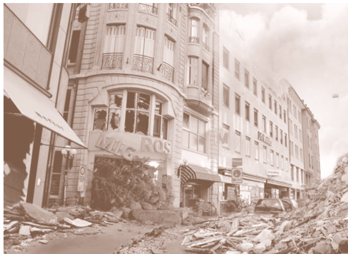
Ältere Bauwerke sind oft nicht erdbebensicher.

Die Kantone setzen sich heute verstärkt für erdbebensicheres Bauen ein. Die SIA-Normen 260ff schreiben vor, wie Tragwerke ausgestaltet werden müssen, damit sie ein Referenzerdbeben mit einer Wiederkehrperiode von 475 Jahren aushalten. Ein Haus erdbebensicher zu bauen, kostet laut Peter Blumer 1–2 Prozent der Rohbausumme oder 0.5–1 Prozent der gesamten Neubauskosten. Für die Sanierung eines bestehenden Gebäudes sind hingegen bis zu 25 Prozent der Neubauskosten zu veranschlagen. Bei den unverhältnismässig hohen Kosten, die sich beim erdbebengerechten Nachrüsten einer bestehenden Baute aufdrängen, wird der Bauherr eher geneigt sein, eine private Versicherungslösung zu suchen.